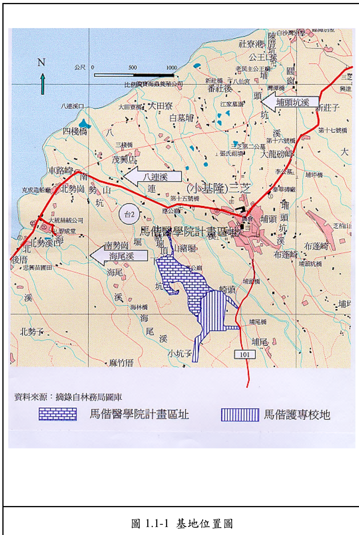
圖 1.1-1 基地位置圖